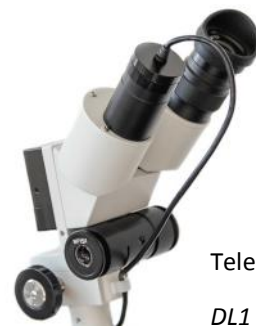
Telecamera USB DL1