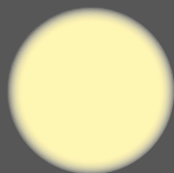
illuminazione alogena halogen light

Emissione luminosa a spettro solare Durata del diodo Led 45.000 ore Consumo di corrente ridotto ad 1/20 Flusso luminoso equivalente a 170 W Assenza di calore generato Assenza di fibre ottiche Silenziosità nel funzionamento