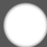
illuminazione Power Led System Power Led System light